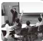
おはなし会の様子