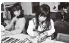
「貯金箱作り」の様子