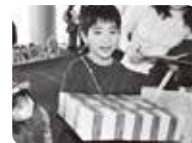
「模擬一億円パック重さ体験コーナー」の様子