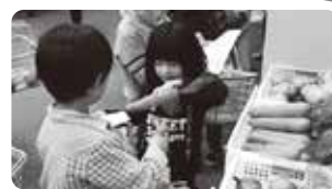
「カレー作りゲーム」の様子