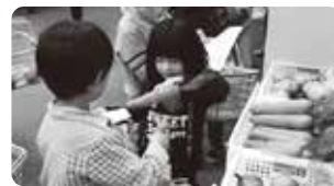
「カレー作りゲーム」の様子