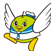
鳥取県マスコットキャラクター 「トリピー」

親子でおかねについて考えるためのきっかけ作りとして、また、先生方の授業に生かせるヒントを見つけるため、ぜひお気軽にご参加ください。