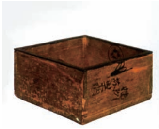
図表 19 検地に使われたものさし*（検地尺）とます（天正枡 芥田家蔵）