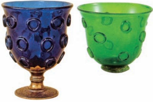
図表 14 紺瑠璃杯(左:高さ 11cm 正倉院宝物)と新羅のガラス製杯(右:高さ約 7cm)