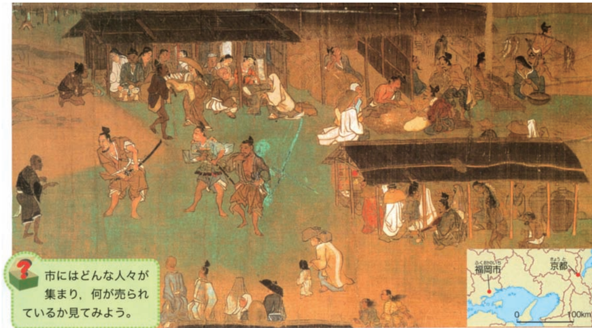
図表 15 市のにぎわい(一遍上人絵伝 神奈川県 清浄光寺〈遊行寺〉蔵)