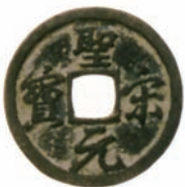
図表 16 宋銭(約24mm 東京都 日本銀行貨幣博物館蔵)