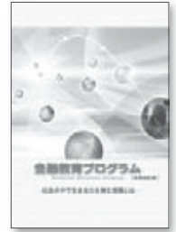
金融教育プログラム [全面改訂版]

詳しくは「金融教育プログラム(全面改訂版)」(知るぽるとホームページ)をご覧ください。