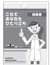
これであなたもひとり立ち ～自立のためのWORKBOOK～ 【指導書】*

教育関係者向けには教材の指導書のほか、電子教材(CD-ROM)もありますので、是非ご活用ください。