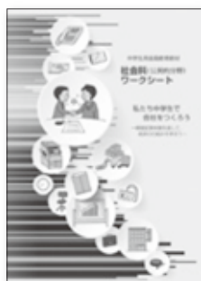
私たち中学生で会社をつくらう ※指導書もあります