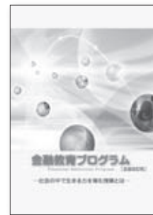
金融教育プログラム [全面改訂版]

A1. 金融教育は、お金や金融の様々な働きを理解し、それを通じて自分の暮らしや社会について深く考え、自分の生き方や価値観を磨きながら、より豊かな生活やよりよい社会づくりに向けて、主体的に行動できる態度を養う教育です。 詳しくは「金融教育プログラム(全面改訂版)」(知るぽるとホームページ)をご覧ください。