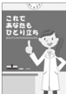
生徒用のワークブック ※指導書もあります