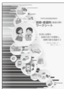
生活に必要な金銭の流れを理解し、消費行動を見直そう ※指導書もあります