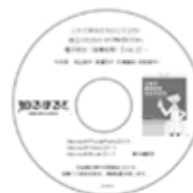
電子教材(指導者用) CD-ROM