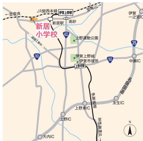
※駐車場は本校運動場をご利用ください。

(事務局:三重県環境生活部くらし・交通安全課内) 〒514-0004 三重県津市栄町1-954 TEL: 059-246-9002 FAX: 059-224-3372