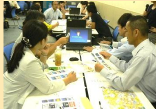
ワークショップの様様