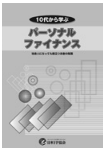
10代から学ぶパーソナルファイナンス

※ファイナンシャル・プランナーとは、家計にかかわる様々なアドバイスや資産設計を行い、合わせてその実行を支援する専門家です。日本FP協会では、高い倫理観と実務能力を兼ね備えたCFP ® 認定者・AFP認定者の養成、認証を行っています。