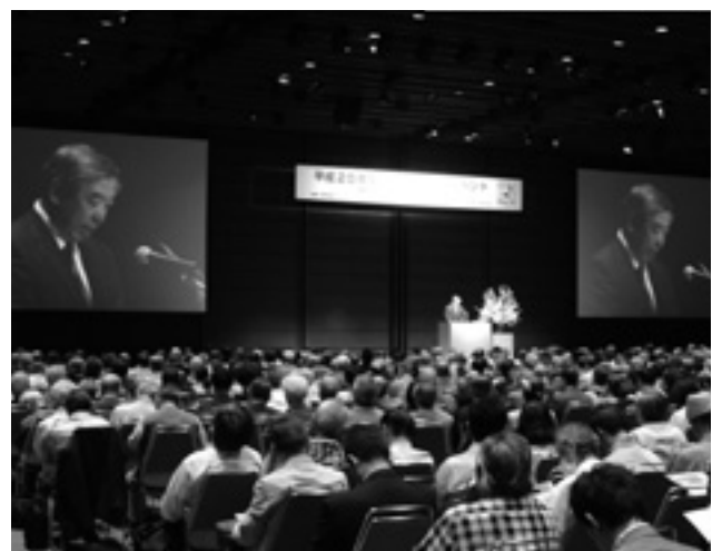
平成25年度「投資の日」記念イベント