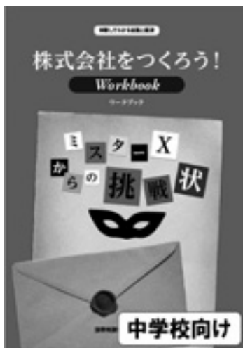
株式会社をつくろう! ～ミスターXからの挑戦状～

本協会の金融・証券知識の普及・啓発活動の詳細については、ホームページ( http://www.jsda.or.jp/manabu/index.html )で公開しておりますので、是非ご覧ください。