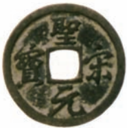
図表 16 宋銭(約24mm 東京都 日本銀行貨幣博物館蔵)