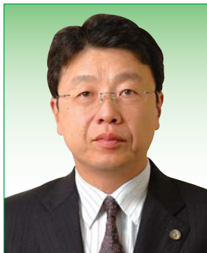
きたむら はるお 北村 晴男氏 弁護士

1956年生まれ。長野県出身。早稲田大学法学部卒業後、1986年に司法試験に合格。