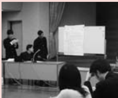
生徒プレゼンテーション