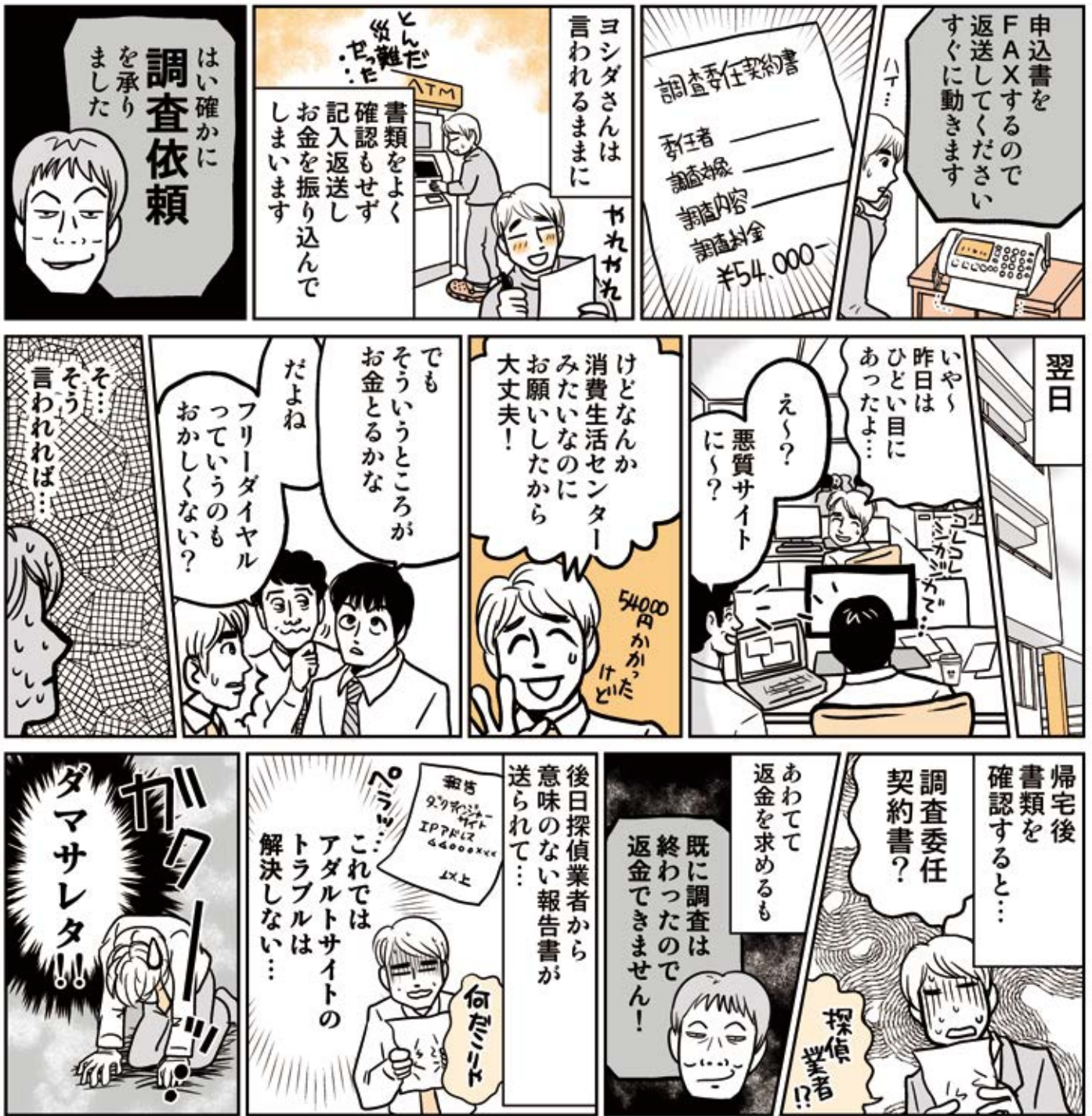
この物語はフィクションです

と勘違いさせるような名称を使っている場合でも、連絡先がフリーダイヤルの場合、自治体の消費生活センターではありません。また、詐欺被害救済を強調したり、契約にお金がかかる話が出た場合は自治体の消費生活センターではありません。