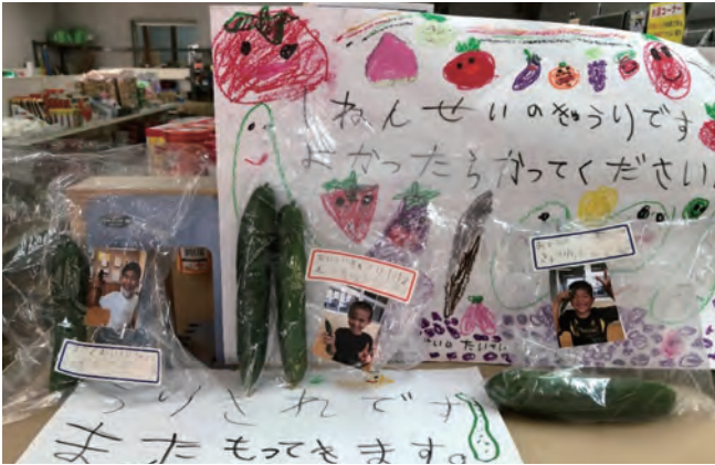
自分たちで収穫したきゅうりに生産者シールを貼り、自作の看板と共に共同売店に陳列。すぐに完売した