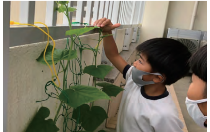
この活動を自分事と捉えるように、プランターを1人ずつ用意。きゅうりとのかげ比べが毎朝の日課になった