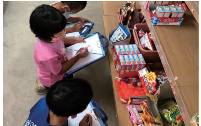
町探検の授業で共同売店へ。気になる商品の値段を調べることで、商品の相場についての感覚的な理解を促した

「お金がかかることを伝えると、お母さんにもらうと言う児童もいれば、諦めモードになる児童も。金融教育の出発点として、お金の必要性を認識する学びになったと思います」。 ■波照間探検隊（生活） ■パーティーをしよう（特別活動） ■野菜を上手に育てよう（生活） 町探検の授業で共同売店へ行ったらあと、友だちと仲良くなるための企画を再度話し合いました。栽培しているきゅうりを共同売店で販売して、そのお金でパーティーを行うことに。 「児童たちの『おいしいきゅうりを売って、パーティーのお金を稼ごう』という目的意識が明確になりました」。 ■値段を調べよう（生活） ■文を作ろう（国語） ■看板を作ろう（図工） きゅうりを1本500円で売りたいと言うなど、児童たちは適正な値段がわかっていなかったため、共同売店で商品の相場を理解させました。 「きゅうりを収穫後、国語で『誰が何を作り、いくらなのか』を伝える生産者シールの文を作成しました。図工では、きゅうりのおいしさを表現する看板を作りました」。 ■大きい数を数えよう（算数） 売上が貯まると、算数の授業で集計を行いました。