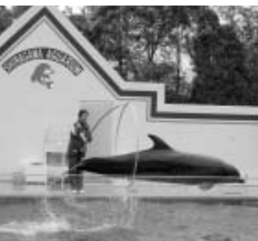
「フープジャンプ」が見事に決まる。息の合ったステージは、日々のトレーニングのたまもの。

飼育を始めた当初は、当然、分からないことだらけでした。イルカたちとどう接したらよいのかさえ、戸惑ったといいます。 「イルカはそれぞれ性格も違います。信頼関係を築く難しさはもちろんです、体調の観察などについても非常に気を使います」 異動して二カ月後には早くも、ショーデビュー、その頃の苦労は?との質問に、「無我夢中、緊張もあつてよく覚えていないんです」という答え。まさに目標に向かって全力疾走の日々だったようです。 経験を積んだ現在も、連日ショーに備えて、トレーニングを欠かしません。かかげた輪の中をくぐる「フープジャンプ」、弓な