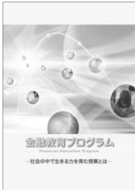
金融教育プログラム 『金融教育プログラム—社会の中で生きる力を育む授業とは—』では、学校における金融教育をより効果的に進めるために、現場の先生方および有識者の協力を得て、小学校、中学校、高等学校における金融教育のあり方や関連する教科等の指導計画例を紹介しています。

平成十七年『金融教育ガイドブック』発刊 ・平成十八年春「金融教育プログラム検討委員会」組成 ②『金融教育プログラム』の内容と関連分野への取り組み ・金融教育の四つの分野 ・年齢層別の金融教育の内容 ・金融教育と学習指導要領の関係 ・学校段階ごとの指導計画例とその特徴 ・当委員会および関係団体等の取り組み